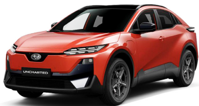
SUBARU Flare Orange Metallic Metalický lak - 750 €