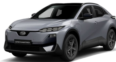
Cement Grey Metallic Metalický lak - 750 €