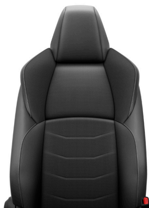
Čierna látka Výbava STYLE