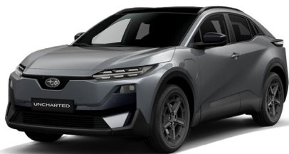
Mineral Metallic Metalický lak - 750 €