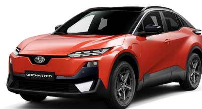
SUBARU Flare Orange Metallic / Attitude Black Mica Metalický lak - 1 000 €