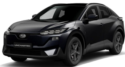
Attitude Black Mica Štandardný lak bez príplatku