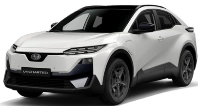
Platinum White Pearl Metalický lak - 750 €