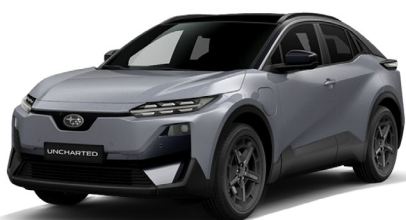
Cement Grey Metallic / Attitude Black Mica Metalický lak - 1 000 €