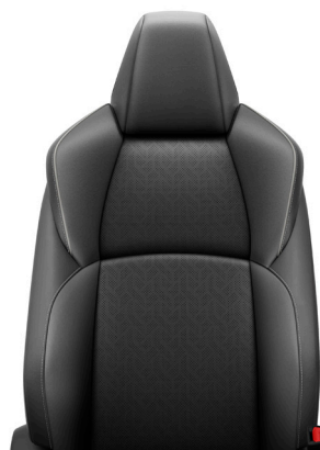
Čierna syntetická koža Výbava PREMIUM / EXECUTIVE X