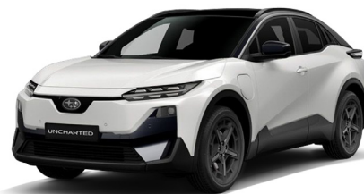
Platinum White Pearl / Attitude Black Mica Metalický lak - 1 000 €